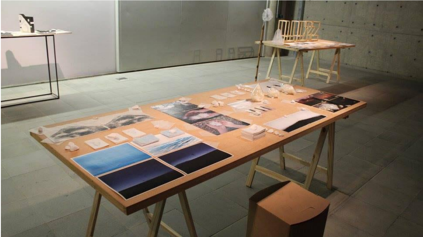
Fig. 5. Vistas das Mesas dos Artistas Luiz Couto e Carlos Eduardo Borges na exposição Sinapses , 2017.

espaço elementos díspares e contrastantes, cuja associação só pode se dar através de um processo associativo livre e multidirecional.