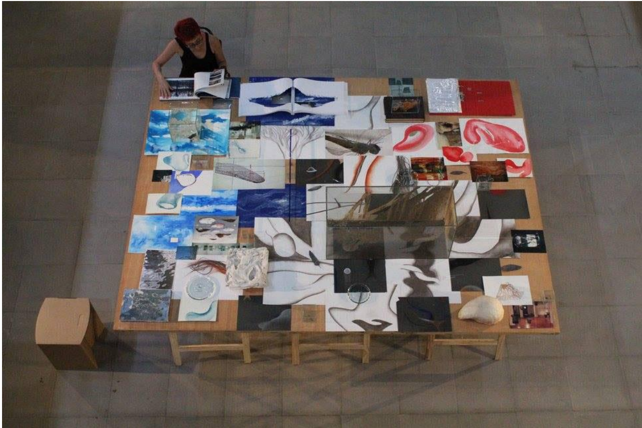
Fig. 7. Vista da Mesa do Artista Hugo Fortes na exposição Sinapses , 2017.

Tentam negar o inevitável. Marcam o fim. Tudo muda." As letras feitas de pó assinalam a própria precariedade do que afirmam, ressaltando o caráter efêmero e mutante do processo artístico e da vida em movimento. A montagem aqui não busca instaurar-se como ponto definitivo de um processo, mas apresenta-se em sua fragilidade e mutabilidade, podendo ser desfeita por um simples gesto da mão sobre a mesa ou até mesmo pelo vento.