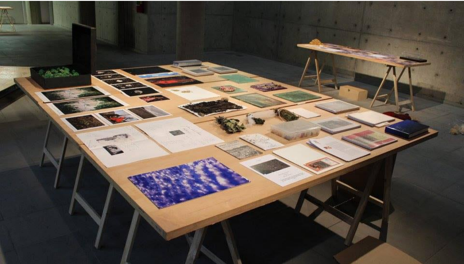
Fig. 2. Vista da Mesa da Artista Dália Rosenthal na exposição Sinapses , 2017.

Vilém Flusser acrescenta ainda que "embora predomine agora no mundo o pensamento expresso em superfícies, essa espécie de pensamento não é tão consciente de sua própria estrutura, assim como o é quando expresso em linhas" (Flusser, 2007: 104). Fugindo às regras da lógica aristotélica que circunscribe o discurso verbal, o pensamento imagético pode acessar áreas menos racionalizadas e comunicar de forma sensível e livre suas mensagens. Sobre a horizontalidade das mesas são dispostas outras superfícies de imagens que conversam entre si, gerando sinapses e produzindo novos sentidos.